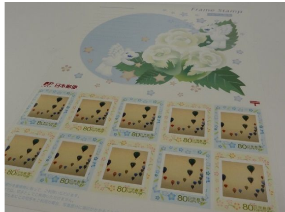
2011 年度 最優秀作品